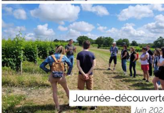
Journée-découverte Juin 2023