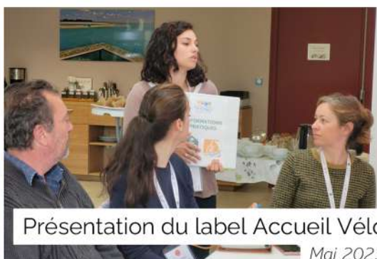
Présentation du label Accueil Vélo Mai 2023