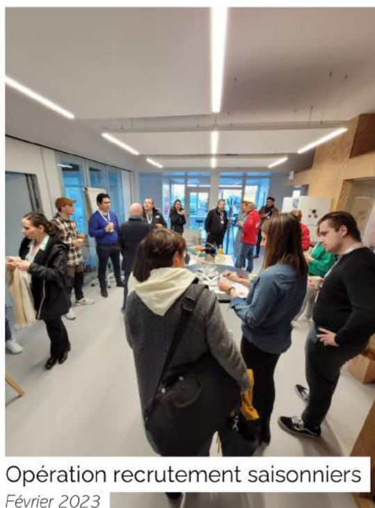
Opération recrutement saisonniers Février 2023