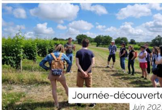
Journée-découverte Juin 2023