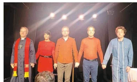
La troupe Les bons amis est née d'une rencontre entre trois passionnés de théâtre.