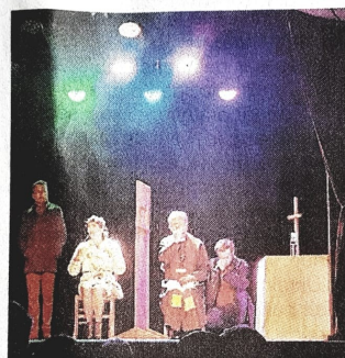
Mardi, la pièce « Pardonnez-moi, docteur » sera jouée par la compagnie nantaise des Bons amis.

Le jeune auteur de cette œuvre a ajouté beaucoup de mots d'esprit et d'humour. La langue de cette pièce, jouée pour la première fois en mai, est très moderne et contribue à interpeller les spectateurs.